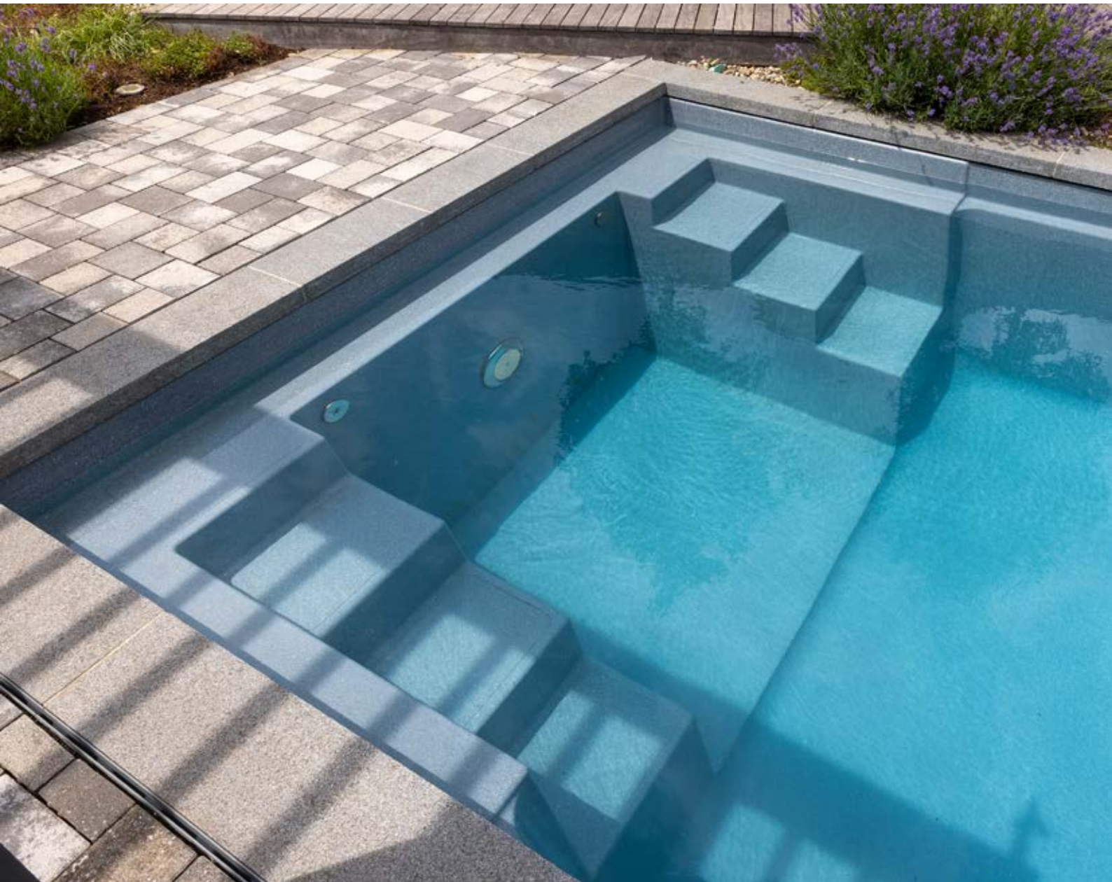
▲ Über die Treppe erfolgt der Einstieg in das Fertigbecken. Das Becken des Pools hat eine Tiefe von 1,5 Meter.

D ie Region Klettgau am Hochrhein ist ein malerisches Fleckchen Erde. Hier lebt eine Familie, die sich gegen einen konventionellen Chlorpool entschieden hat – und das ganz bewusst: »Wir haben uns für einen Naturpool entschieden, weil wir alle kein Chlorwasser mögen. Als wir dann gesehen haben, dass es möglich ist, die Filterzone separat zu gestalten und somit ein »normales« Poolbecken zu haben, war das der Anstoß für einen Naturpool«, sagen die Bauherren. Zudem haben sie sich mit Blick auf die Umwelt für den Bau des Naturpools entschieden, da kein Wasserwechsel not-