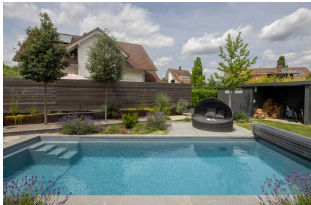
▼ Die Bauherren haben sich bewusst für einen Naturpool entschieden.

D ie Region Klettgau am Hochrhein ist ein malerisches Fleckchen Erde. Hier lebt eine Familie, die sich gegen einen konventionellen Chlorpool entschieden hat – und das ganz bewusst: »Wir haben uns für einen Naturpool entschieden, weil wir alle kein Chlorwasser mögen. Als wir dann gesehen haben, dass es möglich ist, die Filterzone separat zu gestalten und somit ein »normales« Poolbecken zu haben, war das der Anstoß für einen Naturpool«, sagen die Bauherren. Zudem haben sie sich mit Blick auf die Umwelt für den Bau des Naturpools entschieden, da kein Wasserwechsel not-