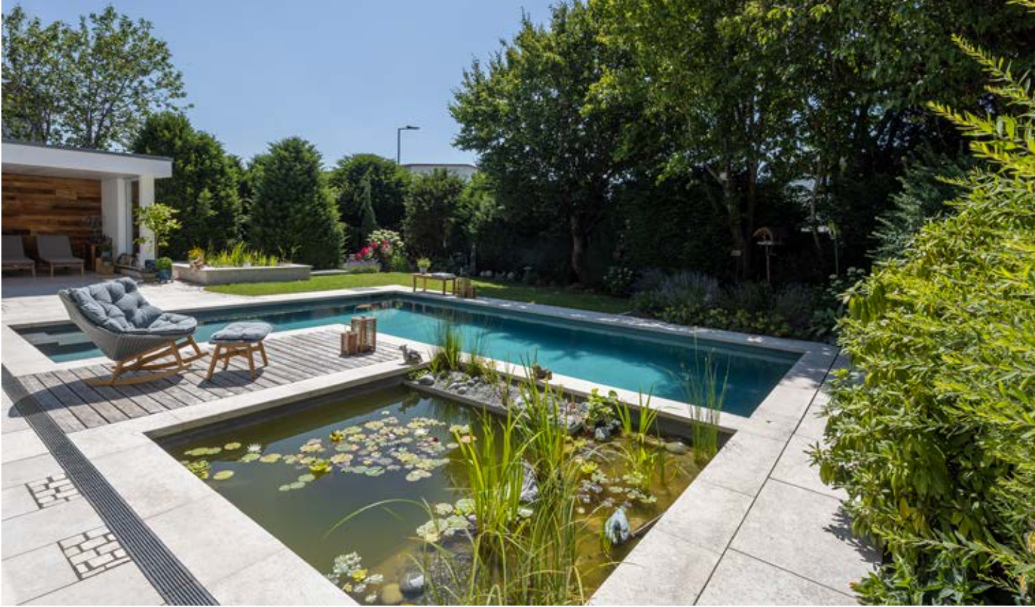
▲ Die Filterzone mit den verschiedenen Pflanzen springt direkt ins Auge. Die Bauherren entschieden sich unter anderem zu Zyperngras.