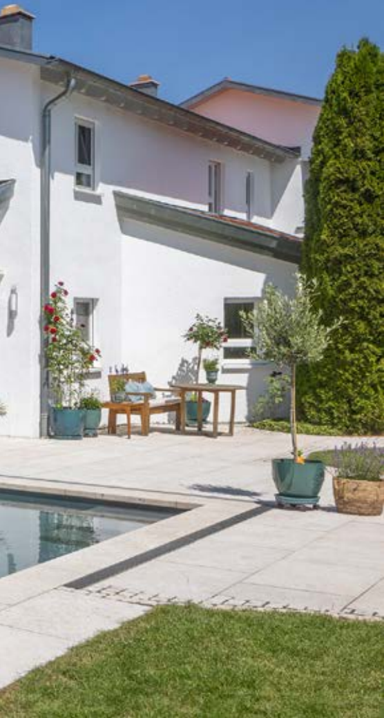
◀ Der große Garten war bereits vorhanden. Schnell entwickelten sich die Pläne hin zum Bau eines Naturpools.

Wohnhaus passt. Darüber hinaus sollte der Pool eine Größe haben, dass man auch problemlos Bahnen schwimmen kann. Zudem legten die Bauherren Wert darauf, dass die Filterzone separat und nicht im Pool integriert war.